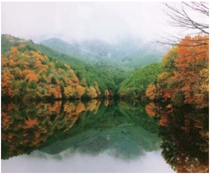
茶倉大賞 / 飯南町粥見高東池