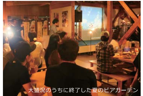
大盛況のうちに終了した夏のビアガーデン

すが、続いて開催している風景画コンテストにも16作品のご応募をいただきました。号数の大きな作品もご応募いただいており、圧巻の展示でした。2階での展示に関するアイデアがございましたらお寄せ下さい。